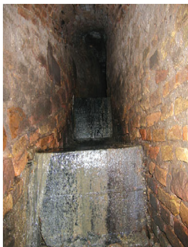
Des cascades permettent de ralentir le débit de l'eau, comme par exemple sous le Parc de l'horloge.